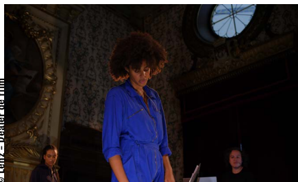
© Lenz - Dealer de film