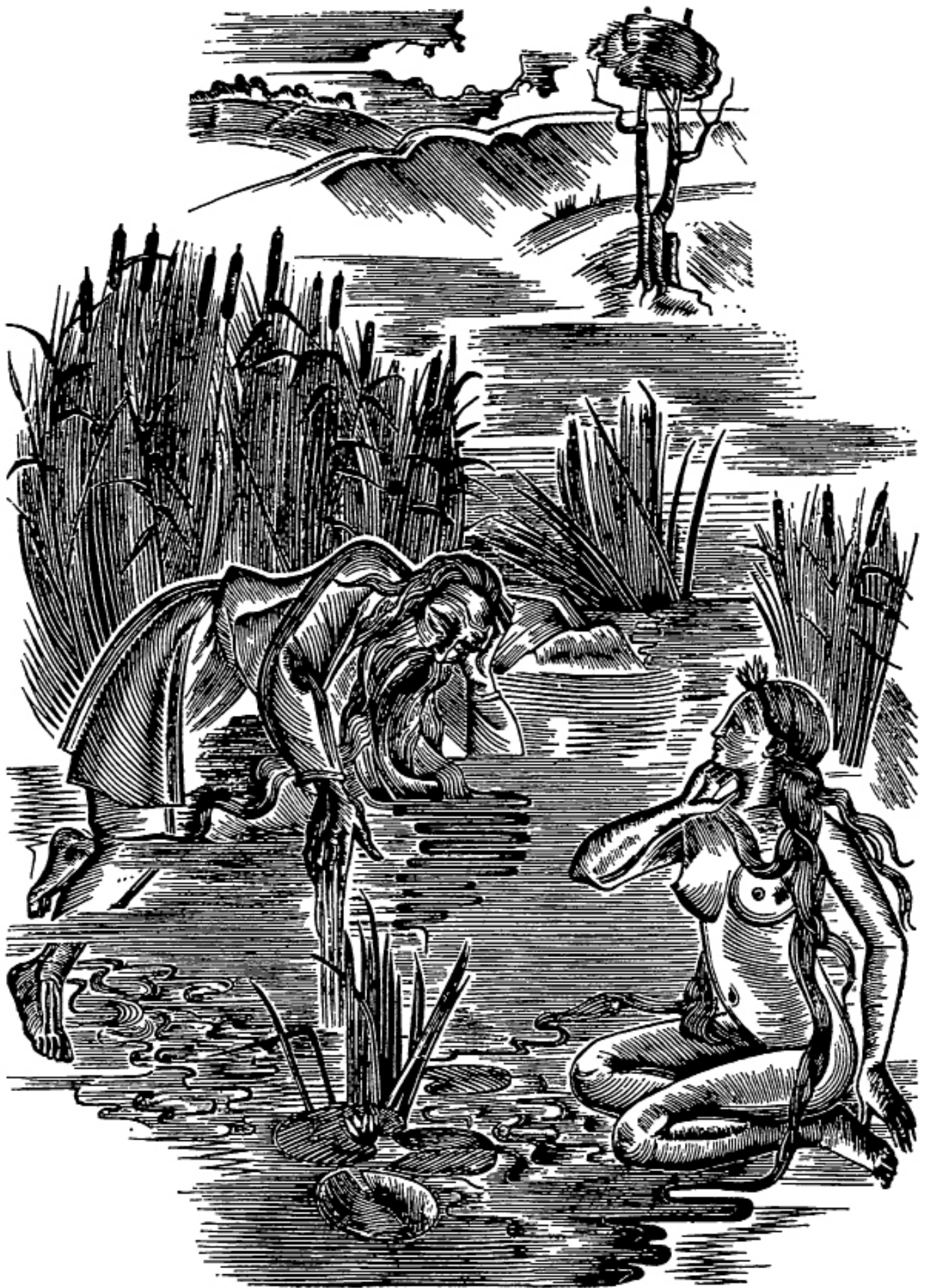
ILLUSTRATION DE OLÈNA SAKHNOVSKA (1973)