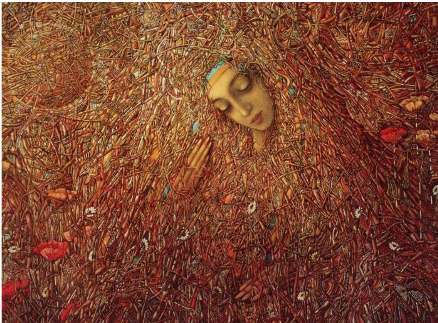
© Éveil , de Marchuk Ivan Stepanovitch (1992)