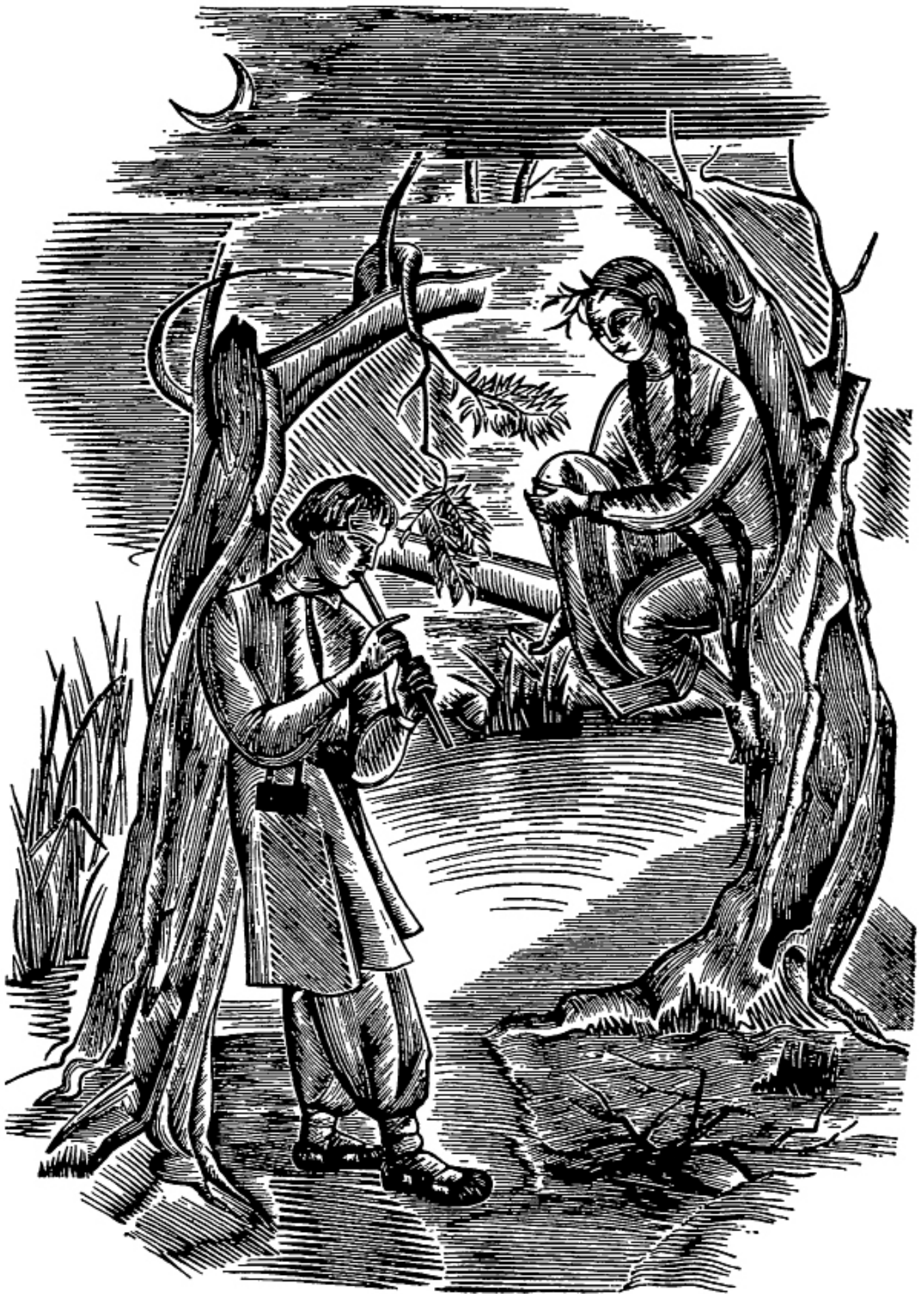
ILLUSTRATION DE OLÈNA SAKHOVSKA (1973)