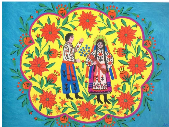
© Lin fleuri et cosaque se rendant chez une jeune fille , de Maria Prymachenko (1982)

Le projet permettra aussi la circulation des publics, la transmission d'un processus de création et la démarche de spectateur·trice qui se jouent. En effet, la pratique artistique n'est pas toujours synonyme de la fréquentation des lieux de création et de diffusion. En prolongement des rencontres entre les différents groupes de jeunes, les participant·e-s rencontreront également les adolescent·e-s-spectateurs·trices du festival, découvriront les autres artistes et spectacles, et pourront avoir un retour sur leur travail, via les nombreuses tables rondes et bords plateaux organisés. Un véritable parcours d'acteur·trice-spectateur·trice se mettra en place pour ces jeunes.