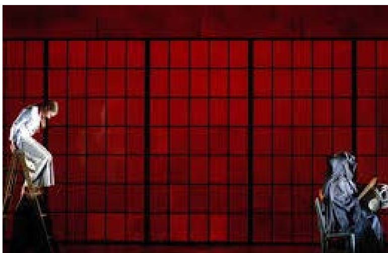
Incendies / Wajdi Mouawad