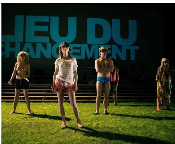
Les particules élémentaires / Julien Gosselin